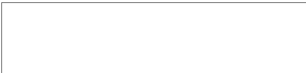
Hình 2.3: Sơ đồ cơ cấu tổ chức phòng marketing công ty ABC

Tên bảng được đặt ngay sau số thứ tự của bảng, chữ thường, in đậm, được đặt ở phía trên của bảng .